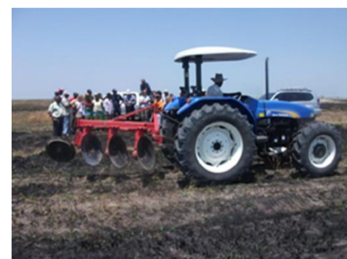
Terra de uma Associação - Gaza