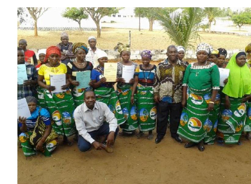
Mulheres exibindo certificados