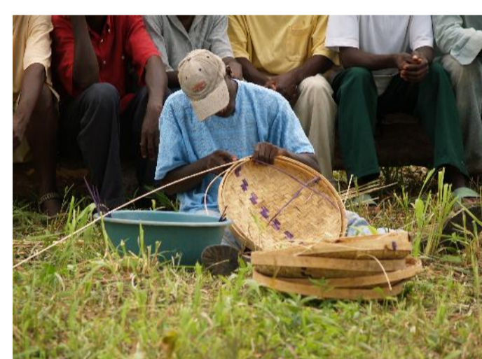
Uso de recursos naturais