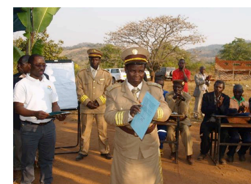
Líder comunitário exibindo certificado