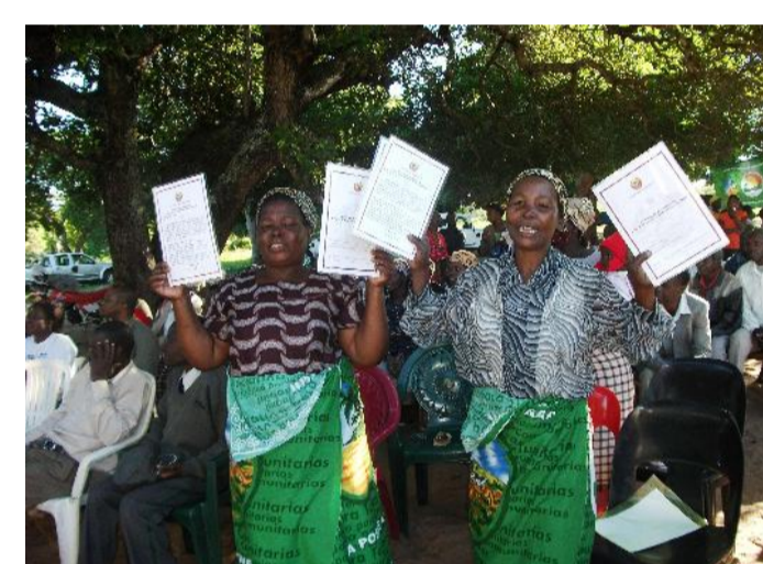
Mulheres exibindo DUATs

A visão da iTC é de ter comunidades rurais com suas terras delimitadas e registadas, e com capacidade para valorizar recursos naturais, e trabalhar em parceria com sector privado, Governo e sociedade civil na promoção de desenvolvimento sustentável, crescimento económico e equidade social.